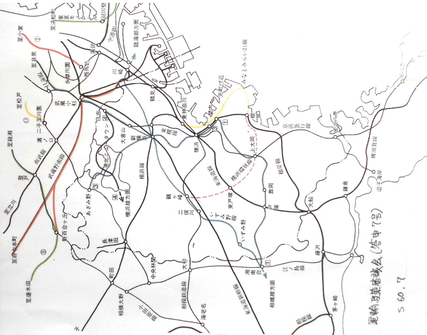
運輸政策委員会(答申7号)