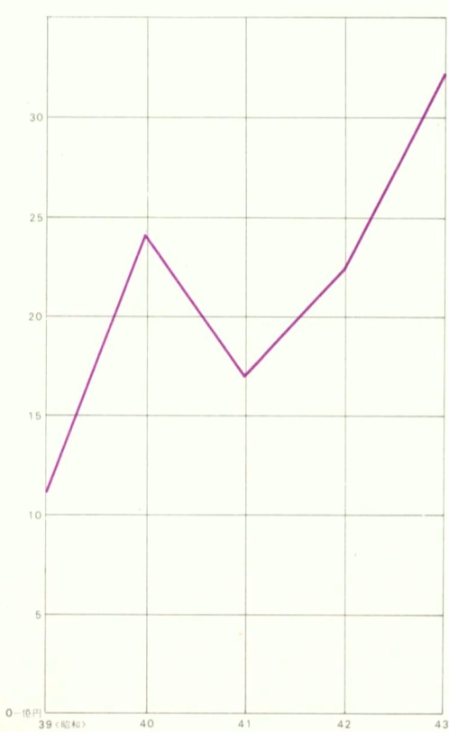
学校建設投資額 Invested Amounts in School House Constructions