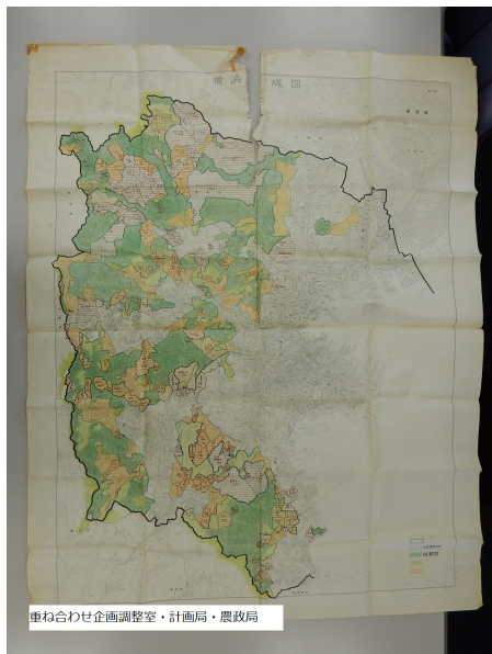
図 14. 重ね合わせ企画調整室・計画局・農政局

また、学識委員の横浜国立大学教授の成田頼明は調整区域内における大規模開発に際して、「遠隔地にある等の理由によって行政主体の公共投資の効率が著しく低下し、そのために本来優先的に市街化する必要度の高い地域への重点的施策が妨げられる危険性のある場合には、市街化調整区域における開発許可により言っている負担を伴ったかたちで開発を実施させるのが妥当である」と述べている。調整区域内の開発が市街化区域内の開発よりおおきな負担をすることを認めている。そして、「我が国の土地政策の大きな隘路の一つとして中央官庁の縦割りのセクショナリズムによる総合性の欠如が指摘されているが、新都市計画法においてもこの欠陥は除去されていないことにかんがみ、土地に係わる行政を現実に実施している地方公共団体においてできる限り、その総合性を確保するように努力することが肝要である」と横浜市の総合性に期待している 8 。