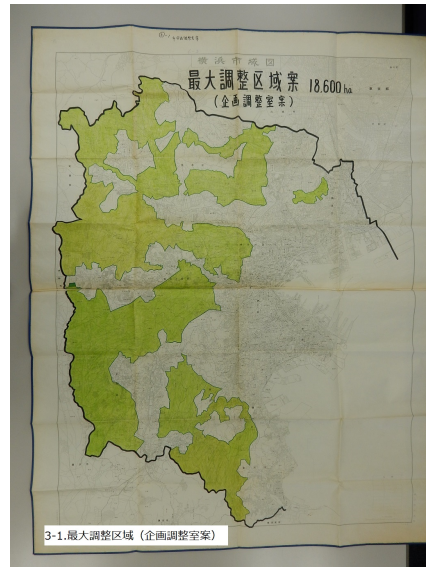
図 3. 企画調整室案（最大規模の調整区域、18,600ヘクタール）