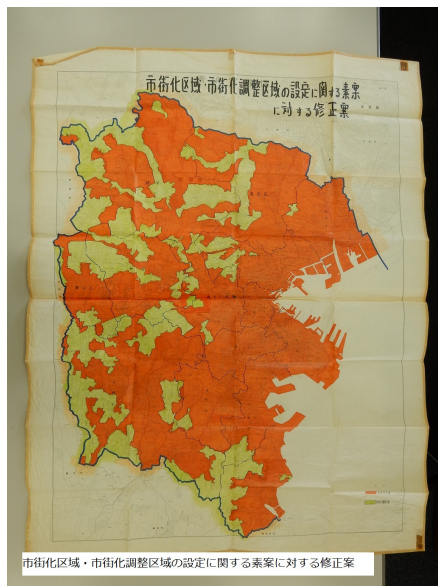
図12. 市街化区域・市街化調整区域の設定に関する素案に対する修正案