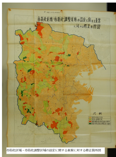
図13. 市街化区域・市街化調整区域の設定に関する素案に対する修正箇所図

素案は調整区域面積が 12,640 ヘクタールで全市の 30.3%であったが、素案への修正が行なわれ最終的に 10,673 ヘクタールで全市の 25.6%となった。当初の企画調整室案の 18,600 ヘクタールには及ばないが、神奈川県案の 6,791 ヘクタールをはるかに凌駕した規模となった。素案がまとまるまでの作業上の苦労は、調整区域設定の細かさから窺い知ることができるが、それ以上に「素案に対する修正箇所」図から区域設定に関する最後の攻防戦があったことが分かる。作業を担当した関係者のご努力に敬意を表したい。