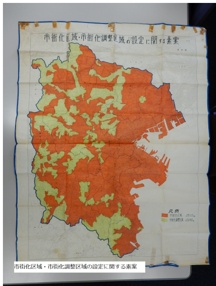
図11. 市街化区域・市街化調整区域の設定に関する素案