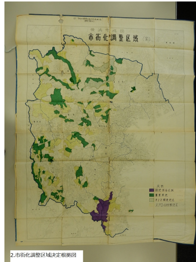
図 2. 市街化調整区域決定根拠図