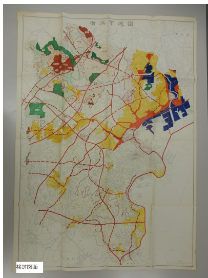
図9. 検討図面 都市計画道路、開発予定地等