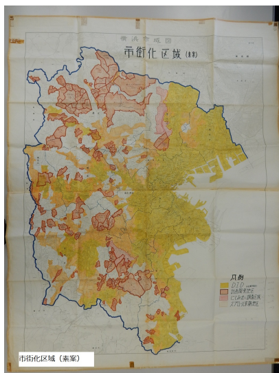
図10. 市街化区域 (素案)