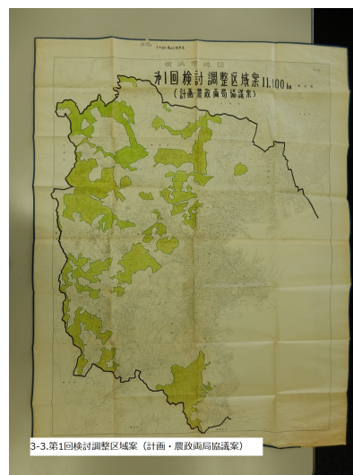
図 5. 計画局と農政局の協議案