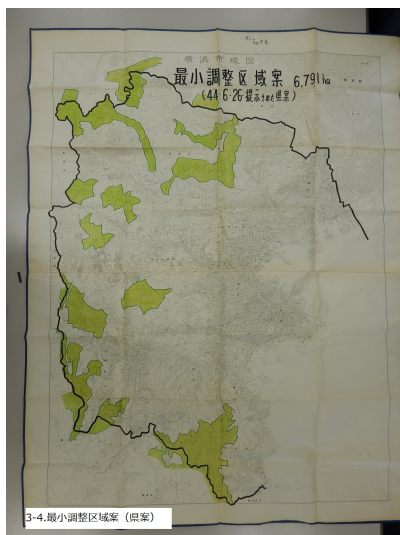
図 6. 神奈川県による案（最小規模の調整区域、6,791ヘクタール）

1970（昭和 45）年 4 月 17 日付の横浜市基本都市計画審議会 5 の答申 6 に、区域設定の基準が記載されている。極めて都市整備についての戦略的意図を感じさせる文言が読み取れる。