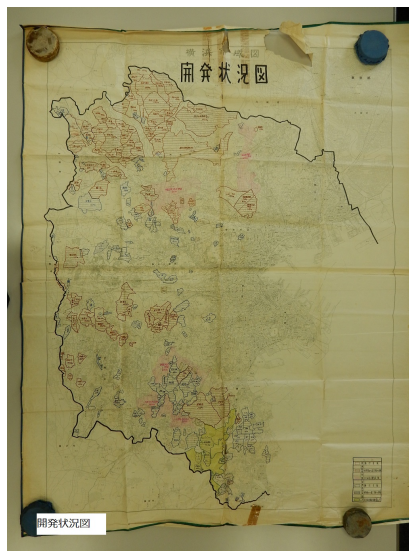
図 8. 開発状況図